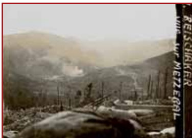
Ausblick in Richtung Metzeral vom Gipfel des Reichackerkopfs, aus den Schützengräben der 1. deutschen Linie

Hunderte von stählernen Schutzschilden, Geschossen, Bomben aller Art, Uniformen, ledernen Ausstattungsgegenständen, Stiefeln von Soldaten, von denen einige menschliche Überreste enthalten, und zerbrochenen Waffen liegen auf dem nicht wiederzuerkennenden Boden dieses von den Menschen entstellten Gipfels verstreut“.