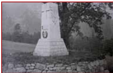
Das durch die Stadt Nice gestiftete Denkmal, im dem Zustand von 1921 (Dokument BDIC - Paris)

An diesem Frontabschnitt, einem wahren im Wald versteckten menschlichen Bienenstock, befanden sich mehrere tausend Soldaten. Sie fanden hier relative Ruhe, die Pflege, der sie bedurften und eine Verschnaufpause, die dem Ausruhen oder dem Reparieren ihrer Ausrüstung gewidmet war. Kehren Sie nach dem Besuch der Unfallstation, die zu der Zeit ein Modell für alle französischen Sanitäreinheiten war, um bis zur letzten Kreuzung. Biegen Sie dann nach rechts auf den Weg ab, der nach ca. 300 Metern zu einem französischen Betonunterstand führt. In mehreren mündlichen Überlieferungen wurde uns bescheinigt, dass dieses Bauwerk in den Jahren 1915 bis 1918 als Unterschlupf für mehrere französische Generäle gedient hat, darunter General Armeau de Pouydraguin.