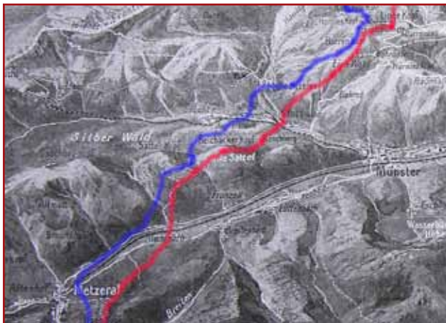
Drawing of the front from July 1915 to November 11, 1918

You have two possibilities to access and leave: