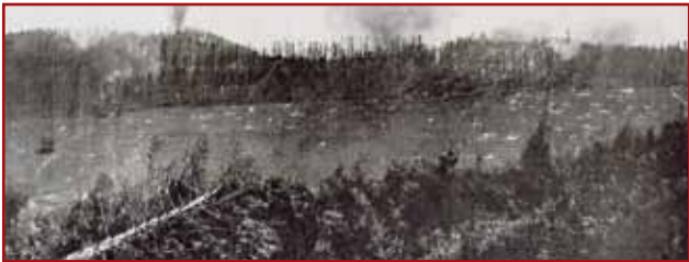
Die beiden Gipfel des Reichackerkopfs von den französischen Stellungen am Sattelkopf aus gesehen

Ab Februar 1915 greifen die Deutschen massiv auf der gesamten Front des Tals an und besetzen den Reichackerkopf. Im März und April 1915 wechselten Angriffe und Gegenangriffe einander ab. Am 6. und 7. März greifen die französischen Alpenjäger des 6. und 23. Bataillons die beiden Gipfel an und können sie unter schweren Verlusten zeitweilig einnehmen. Ab dem 20. März erobern die Deutschen schließlich die beiden von den letzten Kämpfen vollkommen erschütterten Gipfel nach einem schrecklichen Bombenangriff und mit Hilfe herangefahrener junger bayrischer Truppen zur Verstärkung zurück. Ein Wechsel von Schnellfall und Tauwetter machen die Kämpfe noch härter und unmenschlicher. Die Franzosen versuchen mit neuerlichen Angriffen im Mai, Juni und Juli 1915, die beiden Gipfel zurückzuerobern, jedoch ohne Erfolg. Dann stabilisiert sich die Frontlinie und bleibt bis zum Waffenstillstand Schauplatz sporadischer Kämpfe, die weitere zahlreiche Verwundete und Tote fordern. 1918 lösen zwei amerikanische Divisionen die französischen Truppen in diesem Bereich von trauriger Berühmtheit an der Vogesenfront ab.