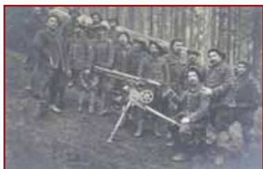
Group of alpine soldiers in the Sattel woods, 1915.

After over 2 kilometres, you will find an indicator on your left guiding you over about 200 metres towards the location of an ancient machine-gunner shelter 21 . During their free time these men created a real work of art. They had inscribed their company number within a firing building, sculpting the whole within a cement coat of arms. Today this sort of shelter built