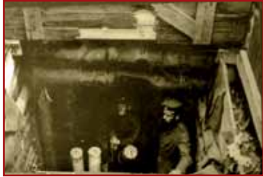
Schwerer deutscher Mörser in Schusstellung am Reichackerkopf

Dieses Bauwerk zeigt die Enge des Lebensraumes der Soldaten sowie die Tiefe der unterirdischen Anlagen. Der hier 1915 aufgestellte Mörser war dazu bestimmt, den Sattel-Pass zu bombardieren, über den die französischen Infanteristen zwangsläufig anrücken mussten. Dieses ziemlich archaische Gerät wurde im Laufe des Krieges durch den berühmten Minenwerfer ersetzt, der für seine Zeit dank seiner technischen Innovationen und seiner Handlichkeit sehr fortschrittlich war.