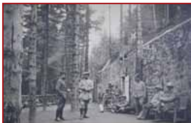
Le bâtiment principal de l'Ambulance alpine 2/75 en 1916

Un petit sentier vous permettra d'accéder à la base de cette plateforme 19 Il s'agit là du bâtiment principal de l'Ambulance Alpine 2/75 implantée dans le camp Nicolas. Ce bâtiment impressionnant, long de plus de 45 mètres à l'origine, servait de corps à une dizaine de salles de soins et d'opérations chirurgicales.