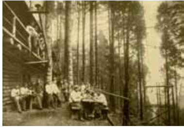
Ambience image with a ferry cable. Many men were busy with these stations, through which much of the material needed for country life passed.

The track will slowly turn towards the right to reach the Moenchberg which directly overlooks the city of Munster. Outside the bend on your left you will see a large concrete platform. It is in fact the concrete covering for an end station of an air-ferry 11 , installed here by the Germans to facilitate transporting heavy materials from the lower track and therefore avoiding the steepness of the slopes in this sector. You can access the building facade from the side to fully gauge its dimensions and inner volume. On the upper part of the facade there is a cement plate with the following inscription: "Umgebaut I Ldst. Inf. Batl. Freib XIV/I Aug. 1917" which means "Modified by the 1st Territorial Infantry Battalion of Freiburg in August 1917." Inside the building we can see the remains of the metal framework which was stripped down by scrap merchants after the war. This significantly crippled the structure of these edifices so we ask you to please be extremely careful when walking around.