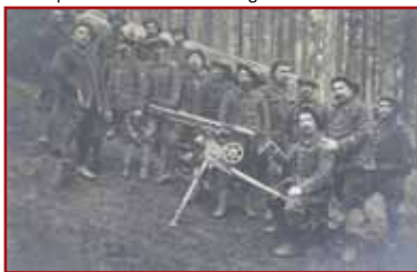
Alpenjägergruppe mit MG im Sattelwald im Jahre 1915

Nach etwas mehr als 2 km finden Sie auf der linken Seite einen Hinweis, der Sie auf ca. 200 m zum Standort eines ehemaligen Unterstandes für Maschinengewehrschützen führt 21. Diese Männer hatten in ihrer Ruhepause ein wahres Kunstwerk geschaffen. Sie hatten ein Wappen mit einem Jagdhorn mit der Nummer ihrer Kompanie in den Zement gehauen. Diese Art von Unterstand aus Rundhölzern oder Stein, die heute selten ist, war zu dieser Zeit aufgrund der Nähe der Frontlinie häufig an den Hängen des Sattelkopfs anzutreffen. Die deutsche Artillerie hatte große Schwierigkeiten, sie auszumachen, denn der Wald bot hier eine wirkungsvolle Deckung und Tarnung.