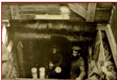
Mortier lourd allemand en position de tir au Reichackerkopf

Cet ouvrage démontre l'étroitesse des lieux de vie des militaires ainsi que la profondeur des installations souterraines. Le mortier installé ici en 1915, était destiné à bombarder le col du Sattel, passage obligé des fantasins français. Cet engin assez archaïque, sera remplacé au cours de la guerre par le célèbre Minenwerfer, très en avance sur son temps grâce à ses innovations techniques et à sa maniabilité.