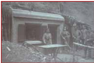
Les abris bétonnés à l'arrière du front, étaient bien souvent très esthétiques et de bonne finition

À cet endroit, vous pourrez découvrir un ouvrage aux formes très complexes et originales 14 . Cet abri, à la fois de protection et d'observation, est l'un des rares ouvrages allemands bétonnés de la région réalisé sur deux niveaux superposés.