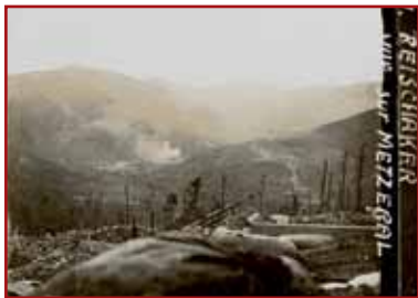
Paysage du sommet du Reichacker, vu depuis les tranchées de 1 ères lignes allemandes en direction de Metzeral

éparpillées. Des centaines de boucliers de tranchées en acier, d'obus, de bombes en tout genre, d'uniformes, d'équipements de cuir, de bottes de soldats dont certaines contenant des restes humains, d'armes brisées, jonchent le sol méconnaissable de ce sommet défiguré par les hommes ».