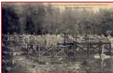
Postcard of the cemetery of Germania, published after the war for the numerous visitors coming from all the regions of France.

one of the largest military cemeteries 18 in this area. Created here as of 1915, following the first massacres during the spring of this terrible year, this place, called Germanien or Germania, was the first burial site for several hundreds of French and American soldiers who remained there until the 1930's under their white wooden crosses.