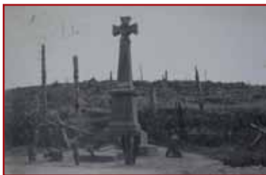
Le monument «De Guardia» au Col du Sattel en 1921

Nécropoles Nationales du Wettstein et du Chêne Millet à Metzeral. De nombreuses victimes reposent toutefois toujours en ces lieux qui sont à considérer comme un véritable sanctuaire.