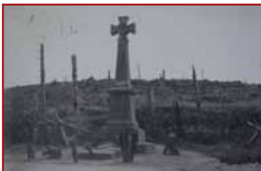
The «De Guardia monument» at the Col du Sattel, 1921.

The first was built in memory of the second lieutenant Jean de Guardia killed here at the age of 20.