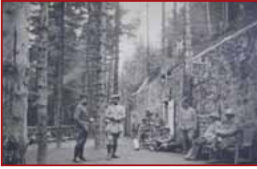
The main building of the Ambulance Alpine 2/75, 1916.

A small path lets you access the base of this platform 19 . It is actually the main building of the 2/75 Alpine Ambulance, established in the Nicolas Camp. This impressive building, initially over 45 metres long, was used as a corps for about ten medical care and surgical units. A concrete water reservoir is also visible under this ensemble all built in granite.