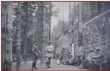
Das Hauptgebäude der Ambulance Alpine 2/75 im Jahre 1916.

Auf einem kleinen Weg gelangen Sie zur Basis dieser Plattform 19 . Es handelt sich hier um das Hauptgebäude der Gebirgs-Unfallstation 2/75, die im Camp Nicolas stationiert war. In diesem beeindruckenden Gebäude, das ursprünglich 45 Meter lang war, befanden sich 10 Operationssäle. Ein Wasserspeicher aus Beton ist ebenfalls unter diesem ganz aus Granit gebauten Komplex sichtbar. In der Umgebung standen weitere befestigte Unterstände, verdeckt durch den dichten Tannenwald. Die meisten von ihnen sind nach dem Krieg zerstört worden. Sie befinden sich hier in einem der bedeutendsten französischen Lager der Region, dem Camp Nicolas, benannt nach dem Kommandanten Nicolas, Chef des 24. Alpenjägerbataillons, der am 21. Juli 1915 am Reichackerkopf getötet wurde.