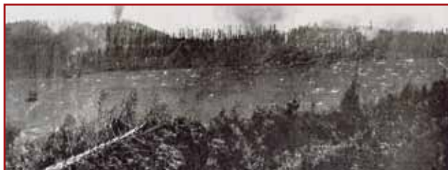
Vue d'ensemble des deux sommets du Reichackerkopf prise depuis les positions françaises du Sattelkopf en 1915

A partir de février 1915, les Allemands opèrent une attaque massive sur tout le front de la vallée et s'emparent du Reichackerkopf. Tout au long des mois de mars et avril 1915, les attaques et les contre-attaques se succéderont. Ainsi, les 6 et 7 mars, les chasseurs français des 6 ème et 23 ème bataillons alpins attaquent les deux sommets, réussissent à les prendre temporairement au prix de lourdes pertes. Dès le 20 mars, les Allemands, après un terrible bombardement et l'acheminement de jeunes troupes bavaroises en renfort, finissent par reprendre les deux sommets complètement bouleversés par ces derniers combats. Les chutes de neige et les dégels successifs rendront ces combats encore plus âpres et inhumains. De nouvelles attaques françaises tenteront de reprendre ces deux sommets en mai, juin et juillet 1915, sans succès. Ensuite, la ligne de front se stabilisera et restera, jusqu'à l'armistice, l'enjeu de combats plus sporadiques causant encore de nombreux blessés et tués. En 1918, deux divisions américaines viendront relever les troupes françaises sur ce secteur tristement célèbre du front des Vosges.