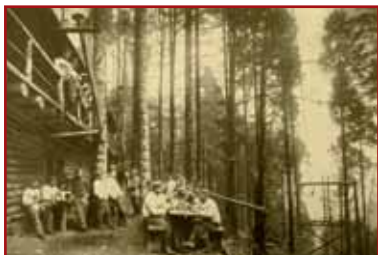
Image d'ambiance auprès d'un câble transbordeur. De nombreux hommes étaient affairés auprès de ces stations par lesquelles transitait une grande partie des matériaux nécessaires à la vie en campagne

Le chemin va lentement tourner vers la droite pour rejoindre le Moenchberg qui domine directement la ville de Munster. A l'extérieur de ce virage, sur votre gauche, vous allez apercevoir une grande plateforme de béton. Il s'agit en fait de la dalle de couverture d'une station d'arrivée d'un câble transbordeur 11 installée ici par les Allemands pour faciliter l'acheminement de matériels lourds depuis le chemin inférieur et ainsi s'affranchir de la