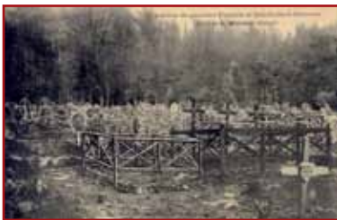
Carte postale du cimetière de Germania, éditée au lendemain de la guerre pour les nombreux visiteurs venant de toutes les régions de France