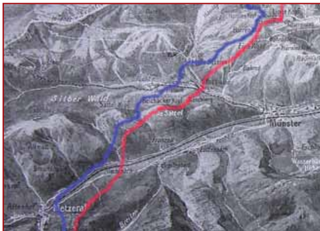
Tracé du front de juillet 1915 au 11 novembre 1918

Deux possibilités d'accès et de départ s'offrent à vous :