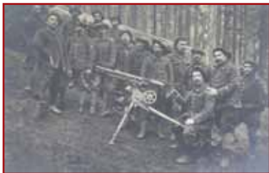
Groupe de chasseurs alpins mitrailleurs dans le bois du Sattel en 1915

temps de repos, réalisé une véritable œuvre d'art. Ils avaient inscrit dans un corps de chasse le numéro de leur compagnie en sculptant le tout dans un blason de ciment. Aujourd'hui rares, ce type d'abris, construits en rondins de bois ou en pierre, étaient, fréquents, à cette époque, sur les pentes du Sattelkopf en raison de la proximité de la ligne de front. L'artillerie allemande avait beaucoup de difficultés à les repérer car la forêt assurait ici une couverture et un camouflage efficace.