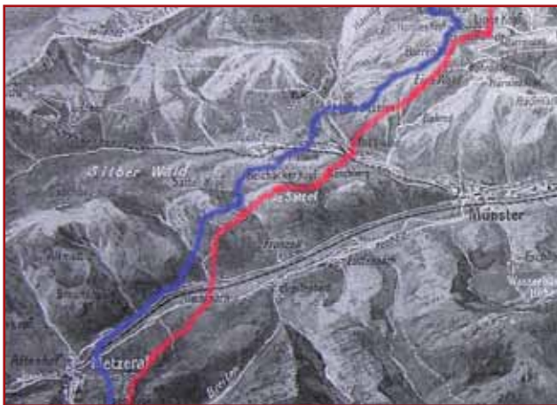
Verlauf der Frontlinie von Juli 1915 bis November 1918